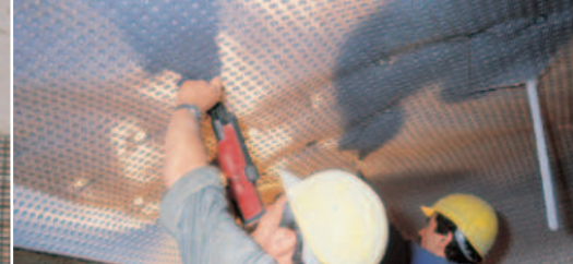
Könnyen rögzíthető a falon.