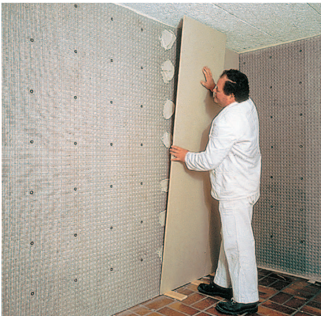
A DELTA®-PT szilárd alapot képez gipsz és mészcement vakolatok vagy gipszkartonlapok számára.