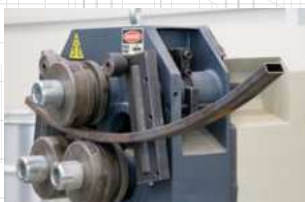
Vendo Durma HPK 40 hidraulikus idom- és csőhajlítógép