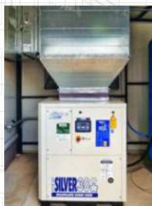
New Silver 30 kompresszor