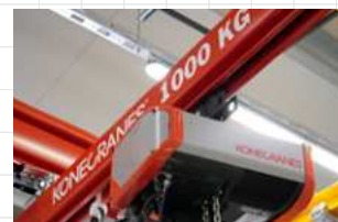
KoneCranes 1000 kg futódaru