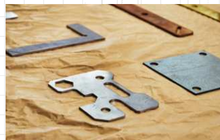
Lézervágó gépünk többfajta fémből szinte minden alakzatot ki tud vágni