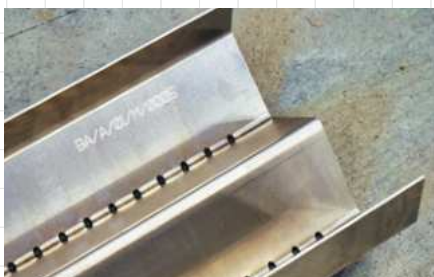
BoostAir® csepegtetőtálca - alumíniumból készült, gravírozott felületű, lézervágott és élhajlított