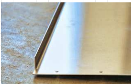
A méretre vágott munkadarab precízen, a kívánt formára hajlítva