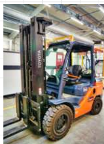
Toyota Toner 3,5 t targonca