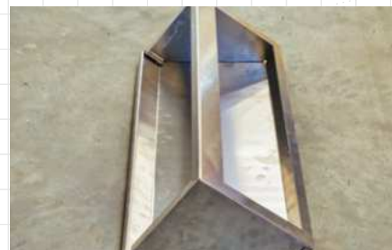
Boostair® légbeszívó ház fedéllel